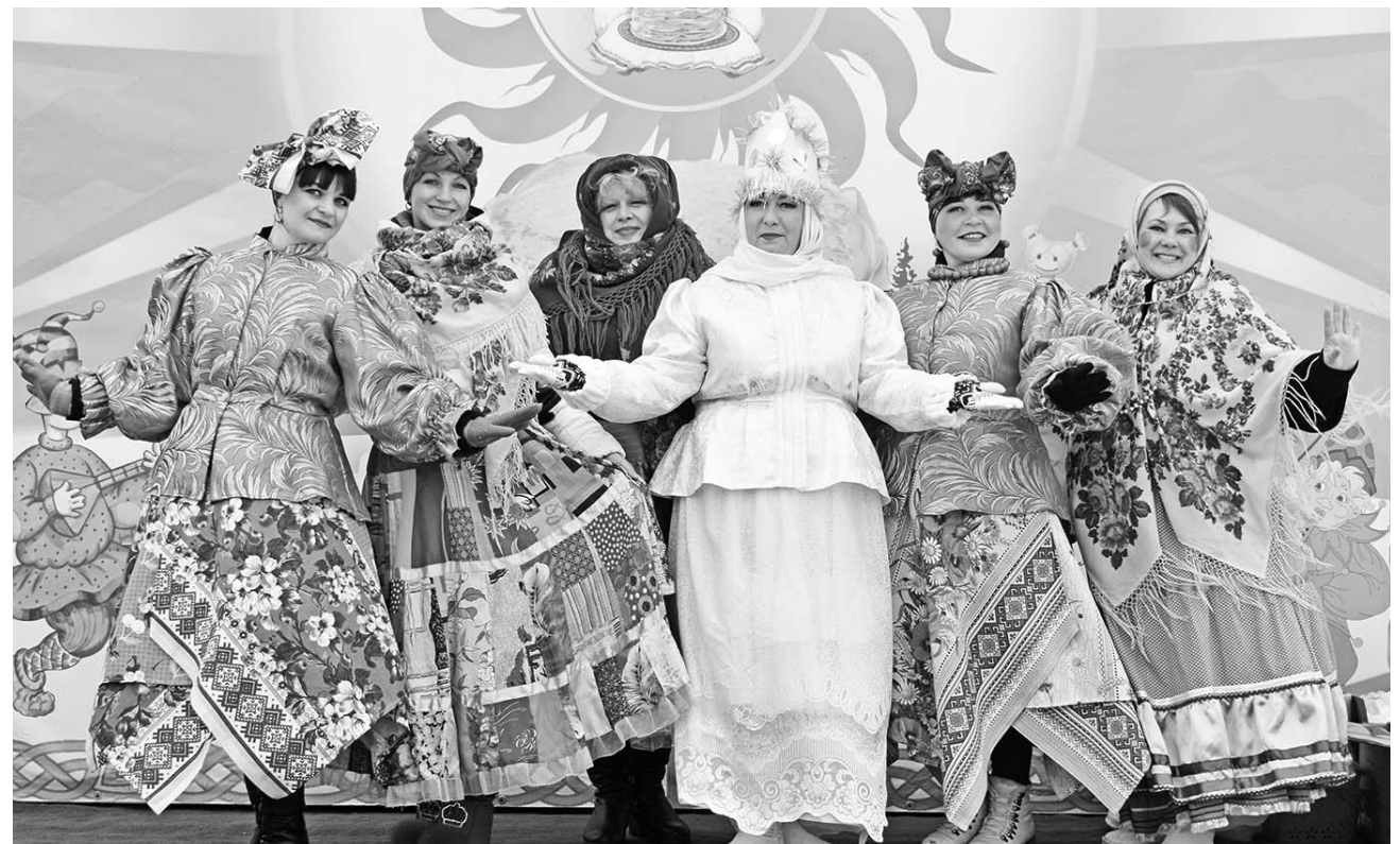
Рассказ о празднике – на 4 стр.

В нашем районе 14 марта прошли народные гуляния. Широкая Масленица – с песнями, частушками, забавами, с горячими блинами запомнится участникам праздника. Зимы с почетом проводили. Ждем весну!