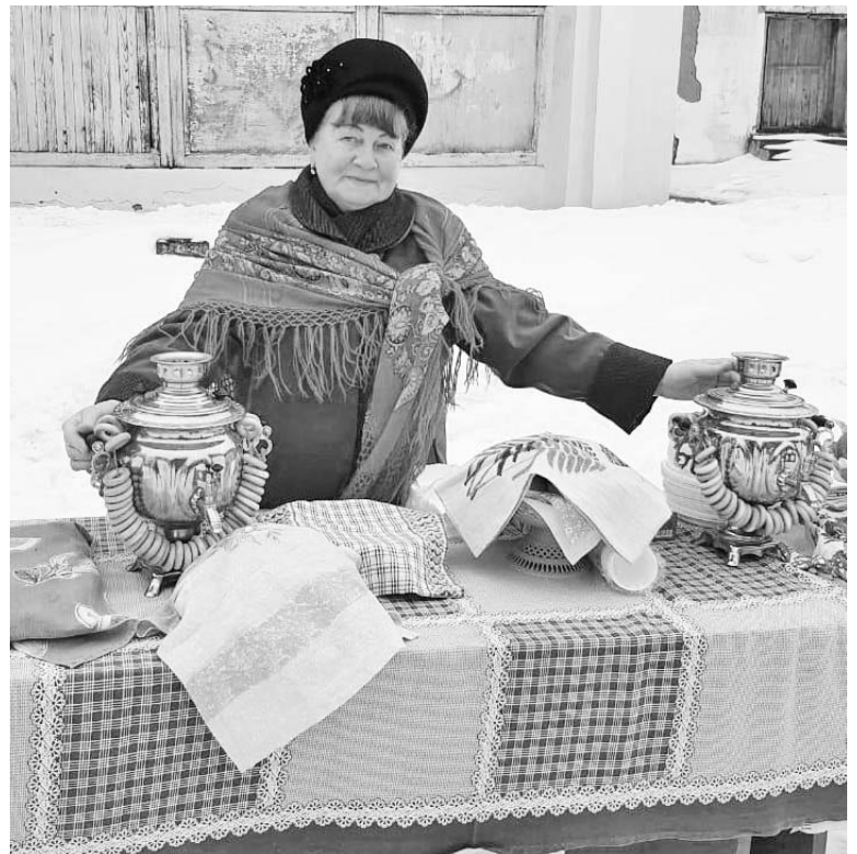
На празднике в селе Чернышено.

комила собравшихся с историей Масленицы, провела викторину, загадала загадки.