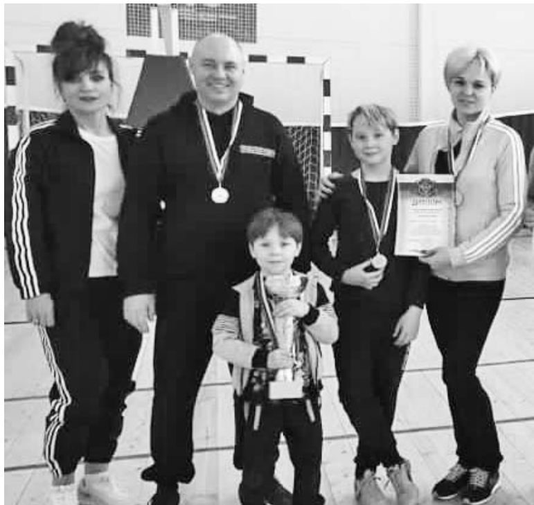
Спортивная семья Пискаревых к труду и обороне готова.